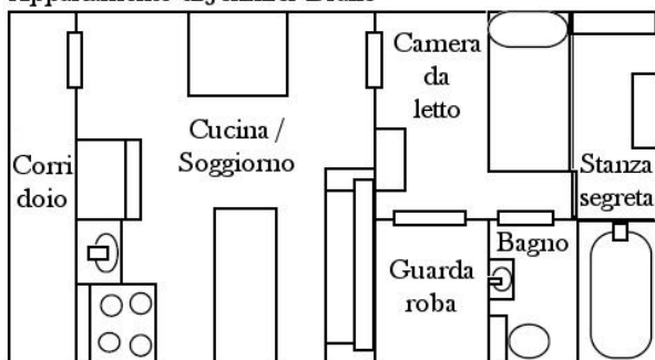
Appartamento di Jennifer Drake

Cucina/Soggiorno: In questa stanza ci sono una cucina, dei mobili, un televisore con videoregistratore e uno stereo. Non c'è nulla di insolito da scoprire.