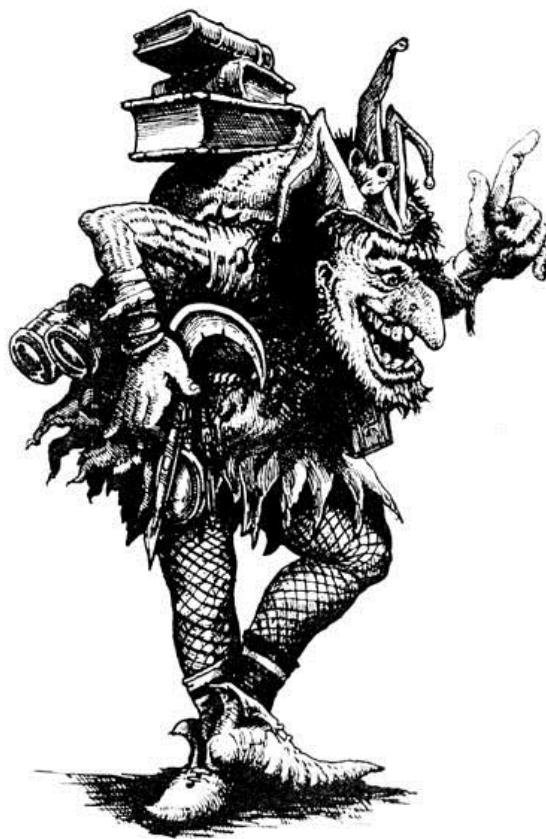
Immagine non soggetta a diritti d'autore di Tony Hough http://www.tonyhough.co.uk/

In una ben nota occasione pubblica, un gruppo di avventurieri noto come "la Compagnia del Fiore Giallo" ha fatto molto meglio di voi, provocando una pubblica umiliazione.