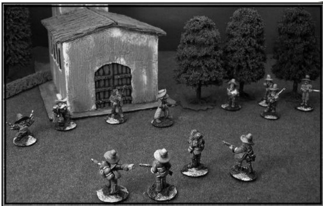
HICKORC E LA SUA UNITA' DIFENDONO LA RAGAZZA E LA CHIESA

La partita dura 10 Turni, dopodiché termina con l'arrivo della posse, ma lo scenario si conclude non appena uno schieramento raggiunge le condizioni di vittoria completa nei confronti del nemico.