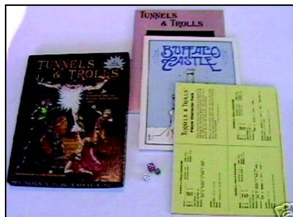
La versione in scatola (statunitense) di Tunnel & Troll, altro gioco finito nella semi oscurità