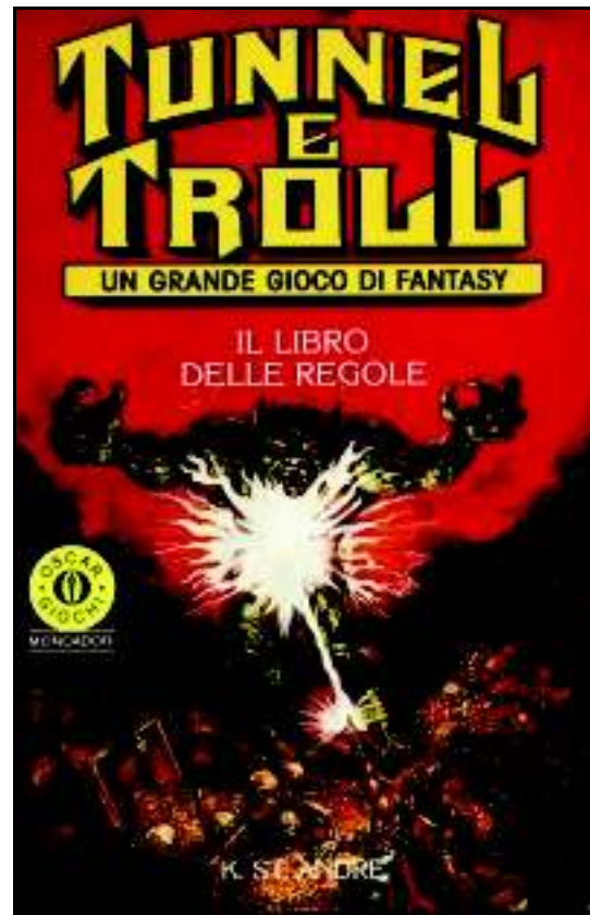
L'edizione italiana di Tunnel & Troll , uno dei giochi di ruolo in italiano più rari da trovare

Allo stato attuale, i nostri progetti sono concentrati sulla realizzazione di materiale originale per alcuni dei grandi classici del mondo dei giochi di ruolo, Dungeons & Dragons Classico e Tunnels & Trolls su tutti.